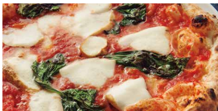
燻製モッツァレラのマルゲリータ 1780 Margherita w/ Smoked Mozzarella Cheese 燻製水牛モッツァレラ、トマトソース、バジル、 グラナパダーノ smoked mozzarella cheese, tomato sauce, basil, Grana Padano cheese