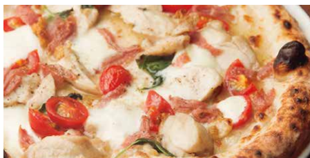
大和肉鶏のディアボラ 1620 Local Chicken Diavola 鶏肉、唐辛子、グラナパダーノ、オレガノ、 ミニトマト、ナポリサラミ、モッツァレラ、バジル chicken, mozzarella cheese, oregano, basil, Napoli salami, Grana Padano cheese, cherry tomatoes, red pepper