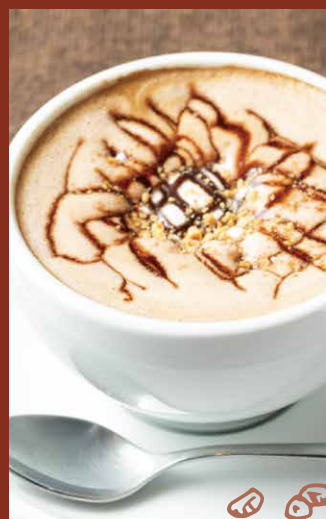
ホットチョコレート HOT CHOCOLATE