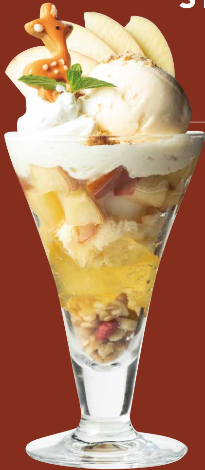
ホワイトチョコとりんごのパフェ WHITE CHOCOLATE & APPLE PARFAIT

グラノーラ、レモンジュレ、りんごジュレ、スポンジ、 バニラアイス、りんごのキャラメリゼ、ホワイトチョコクリーム、 ホワイトチョコアイス、シャンティ、りんご、 クランブル、鹿クッキー