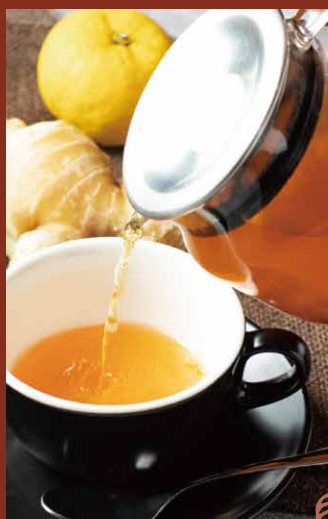
ゆず香る ハニージンジャーティー HONEY GINGER TEA

爽やかな柚子の香りと蜂蜜、 そして生姜をプラスした 寒い冬にピッタリのドリンクです